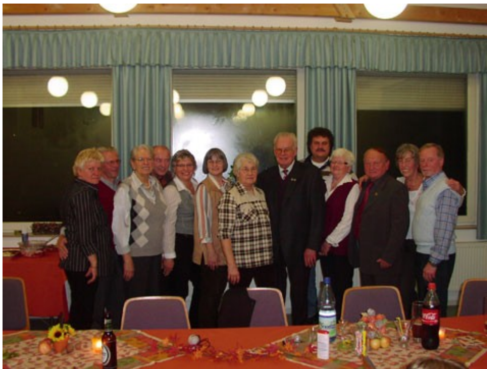
Am 27. Oktober im Gemeindesaal in Oberbiel Geburtstagsfeier mit den Vereinen.

Im Jahre 1981 wurde eine neue Dachorganisation der Arbeitsgemeinschaft zur Förderung der Gehörlosen in Wetzlar und Lahn-Dill Kreis e. V. gegründet, er hat das Amt als 1. Vorsitzender bis 1985 übernommen. Die Begegnungsstätte für Gehörlose hat er von der Stadt Wetzlar erworben, bis heute ist das Gehörlosen- Zentrum, Hainstrasse 8 in Wetzlar erhalten. Am 25. Sept. 1993 (Tag der Gehörlosen in Wetzlar) bekam er den „Landesehrenbrief Hessen“ . Er ist tätig seit 1988 bis heute im Amt als Kassierer des Seniorenclub Wetzlar.